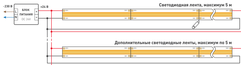
Схема 1. Подключение нескольких светодиодных лент с двух сторон Рекомендуется использовать для обеспечения равномерного свечения ленты по всей длине.