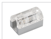
Соединитель прямой Арт. 022701 ARL-CLEAR-U15-Line (26x15mm)