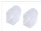
Заглушка Арт. 021240 ARL-U15-Cap