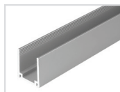
Профиль Арт. 021555 ARL-U15 (26x15mm)