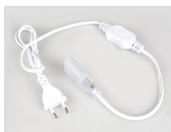
Шнур питания Арт. 021547 ARL-Power-220V (26x15mm)