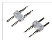
Силовой коннектор Арт. 021241 ARL-2pin