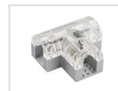
Соединитель тройной Арт. 022703 ARL-CLEAR-U15-2x90 (26x15mm)