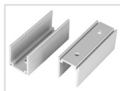
Держатель Арт. 021551 ARL-U15-Clip (26x15mm)